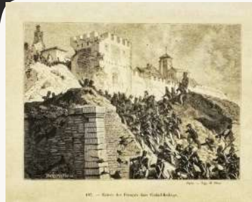
Litografía francesa de la entrada de las tropas napoleónicas en 1810.