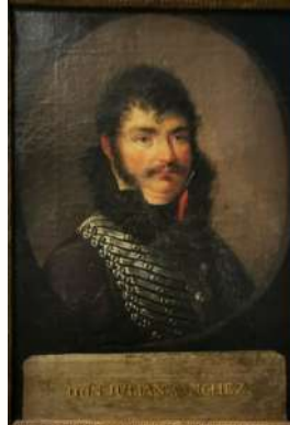
Retrato de Julián Sánchez "El Charro", Anónimo 1812.

Militar español apodado "El Charro", cabecilla del regimiento de milicianos conocidos como "los lanceros de Don Julián", defensores de la plaza durante el asedio francés. Esta guerrilla estaba constituida a principios de 1810 por 240 lanceros llegando a tener hasta 1.000. El panteón de Julián Sánchez, se encuentra junto a la muralla, en la Plaza de Herrasti.