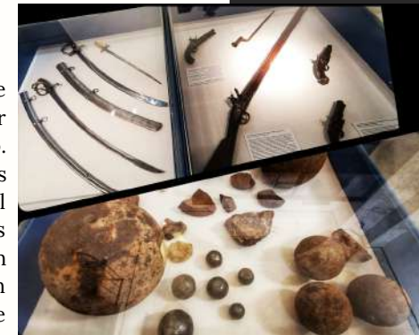
Armas, espadín de "El Charro", sables de Wellington y francés, armas de fuego y bolas de cañón.

En la exposición se pueden observar una serie de armas, reducto de aquellas abandonadas por las tropas, de uno u otro bando, tras el asedio. Destaca la colección de sables donde podemos ver el sable de Wellington, un sable francés y el espadín de "El charro". Junto a ellos, podéis encontrar mosquetes, pistolas y balas de cañón de diferentes calibres, algunos reciclados en elementos cotidianos como pesas, plomadas e incluso una gaita.