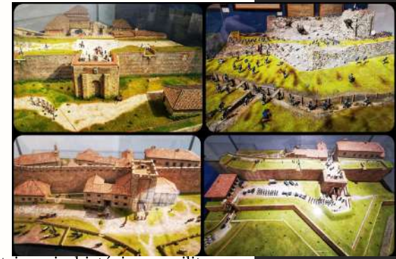
Puerta del Rey y del Conde. Diseño: Alberto Mateos

Ciudad Rodrigo atesora un rico patrimonio histórico y militar que ayuda a ilustrar los relatos de aquellos años de enfrentamiento. Las brechas en la muralla evidenciarán el imparable avance en la expulsión de las tropas napoleónicas de la Península, tal y como puede verse en las maquetas expuestas, brechas que representan la realización de los deseos de ambos ejércitos: la conquista de Ciudad Rodrigo. En estas maquetas, puede verse la evolución de la ciudad desde los orígenes en el siglo XII hasta nuestros días, con el cambio estructural de nuestra bella muralla.