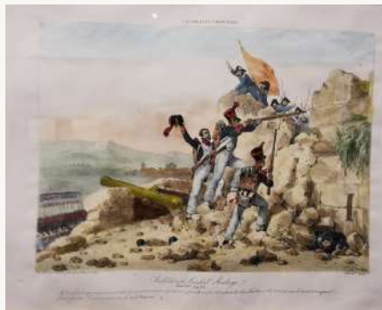
Litografía rendición de Ciudad Rodrigo 1810. Charles Motte 1815

Ciudad Rodrigo entre 1810-1812 , sufrió dos asedios. El 25 de Abril de 1810 , Ney, solicita al gobernador su rendición a lo que Herrasti se negó, dando así comienzo al sitio de Ciudad Rodrigo y la defensa de la plaza. Las tropas imperiales desplegaron cerca de 96.000 soldados frente a los 6.000 soldados españoles resguardados dentro de la muralla. La batalla duró 76 días a la espera de la ayuda inglesa. A la vista que esta no llegaba y tras la caída de la Puerta del Rey situada frente a la catedral donde abrieron brecha, a Herrasti no le quedó más remedio que capitular y entregar la ciudad a los franceses. Las tropas napoleónicas tomaron por fin la ciudad el 10 de julio de 1810 y permanecieron en ella hasta el 19 enero de 1812 , cuando las tropas inglesas bajo las ordenes de Wellington tomaron la ciudad, abriendo a su vez una nueva brecha.