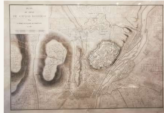
Plan du Siège de Ciudad Rodrigo 1810, J. Belmas. París 1860.

Wellington , soldado irlandés que capitaneó el ejército inglés en la guerra napoleónica, siendo el liberador de la plaza de Ciudad Rodrigo el 19 de Enero de 1812, este acto le valió para ser nombrado de Duque de Ciudad Rodrigo y obtener la medalla al valor por liberar la ciudad de manos francesas.