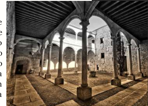
Patio plateresco del Palacio de los Águila, José Antonio Hernandez

Construido en el siglo XVI, por el linaje de los Águila, alcaides de la ciudad. De estilo renacentista destaca el patio plateresco, parte del cual fue dañado durante el asedio francés. Este palacio fue lugar de festejos tras la victoria inglesa, celebrándose en su salón principal el baile de la victoria organizado por Wellington.